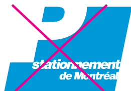
Déformer ou modifier la forme du logo