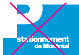
Modifier les proportions du logo