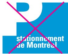
Recréer le logo