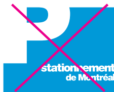
Modifier le rapport entre la taille des éléments.

Voici quelques exemples des erreurs les plus fréquentes à éviter.