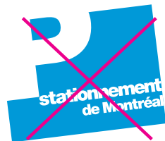
Reproduire le logo en angle