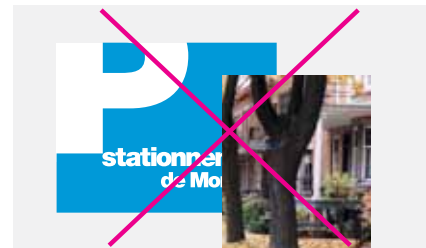
Ne pas respecter la zone de dégagement autour du logo