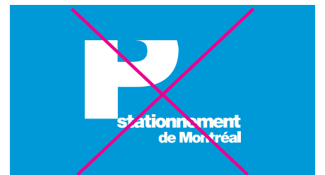
Retrancher un des éléments qui forme le logo (ex.: le rectangle)