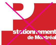
Utiliser une couleur autre que le noir ou le Bleu process