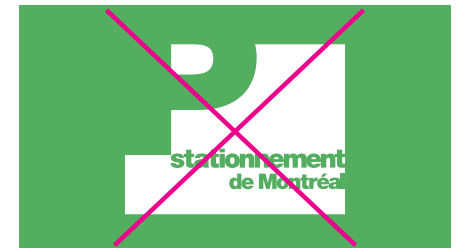
Reproduire le logo en renverser sur un fond de couleur autre que le Bleu Process